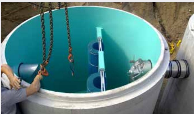
DYWIDAG Abscheideranlagen, ARAL Tankstellen