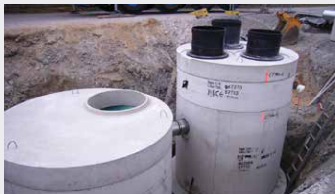
DYWIDAG Abscheideranlagen, BP Europe SE