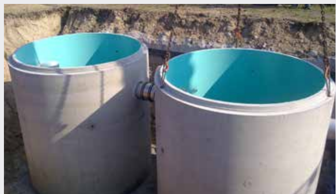
2x DWYDAG Optimus NS 20, BP Europe SE