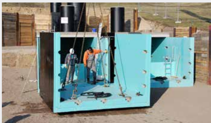
RiStWag und Abscheideranlagen, Waldschlößchenbrücke Dresden

* Alle Preise zzgl. ges. MwSt. – frei Baustelle, nicht abgeladen (auf Wunsch inkl. Versetzen)